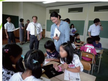
倶知安小学校での 雪プロ夏セミナー