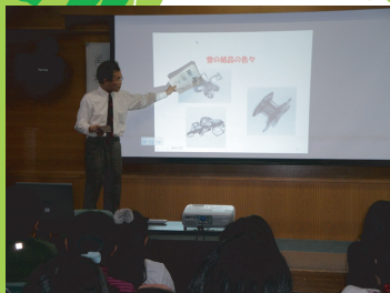
3年出前授業 雪の結晶はなぜできる？