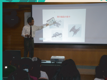
3年前出前授業 雪の結晶はなぜできる？