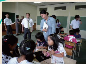
倶知安小学校での 雪プロ夏セミナー