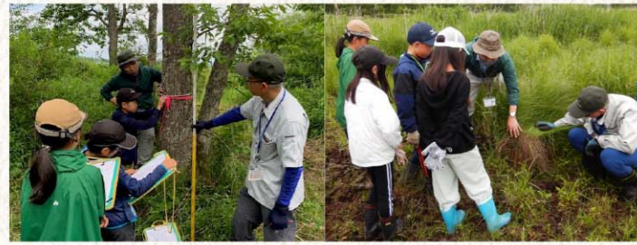
鶴居村立下幌呂小学校3、4年生への湿原教育。総合的な学習の時間で、幌呂地区のハンノキを観察したり、湿原植生が回復した様子を学んでいる。

展途上国から河川管理や自然再生を学びに来る人々の受け入れもしている。 釧路市広里地区では、過去の牧草地開発で消失した湿原植生を回復させるため、地盤掘り下げやハンノキ伐採試験を行い、回復手法を検討するとともに、急拡大したハンノキ林をモニタリングしている。 釧路町達古武地区では、湿原周辺の森が荒地化したり、人工林になったことで多様性が失われ