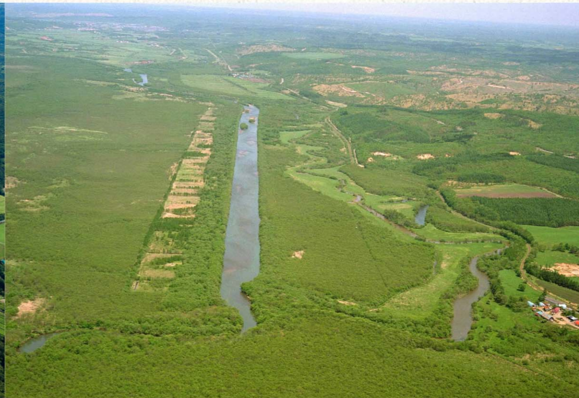
1992年、旧川復元する前の釧路川(茅沼地区)。

少していることに危機感を募らせている。 開拓を進めるためには、洪水氾濫を防ぐことや、地下水の水位を下げて土地利用を可能にすることが必要だった。そこで、