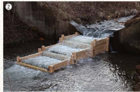
①ヨシやスゲの湿原植生が再生された幌呂地区の景観。 ②2019年に完成した魚道。

展途上国から河川管理や自然再生を学びに来る人々の受け入れもしている。 釧路市広里地区では、過去の牧草地開発で消失した湿原植生を回復させるため、地盤掘り下げやハンノキ伐採試験を行い、回復手法を検討するとともに、急拡大したハンノキ林をモニタリングしている。 釧路町達古武地区では、湿原周辺の森が荒地化したり、人工林になったことで多様性が失われ