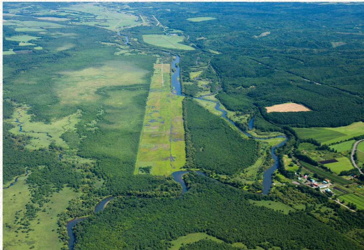
2011年、旧川復元した後の釧路川(茅沼地区)。

付近で営農する農家も参加しておられ、意見を表明できる体制になっています」と言う。 「では、そもそも何のために自然を再生するのだと思いませんか」と、照井さんから問いか